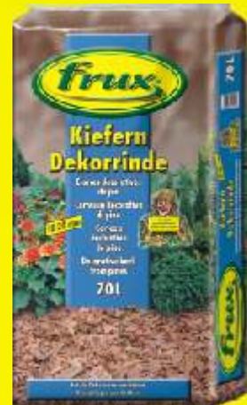
Ecorces décoratives de pin 10-20