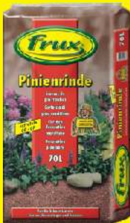
Ecorces de pin fraîches 00-07