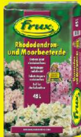
Terreau pour rhododendrons Conditionnements: 10 / 20 / 45 / 70 L