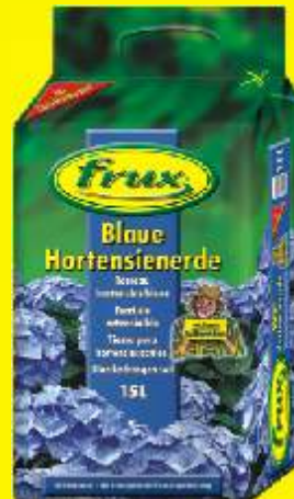
Terreau hortensias bleus