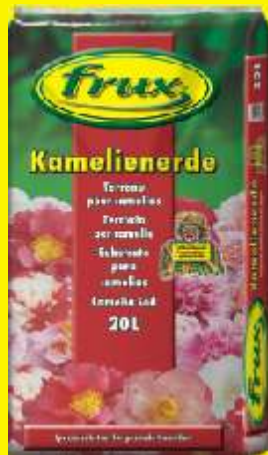
Terreau pour camélias