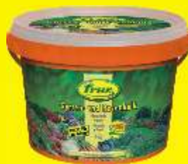
Chaux jardin et gazon