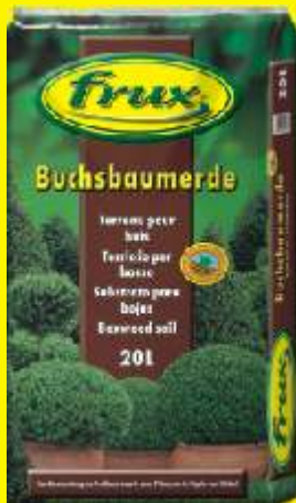
Terreau pour buis