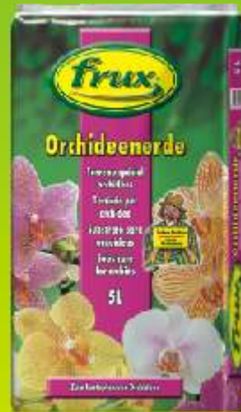
Terreau spécial orchidées Conditionnement: 5 L