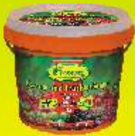
Engrais baies et fruits