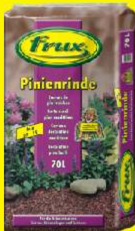
Ecorces de pin fraîches 07-15