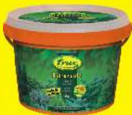
Sulfate de magnésie