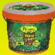
Engrais arbustes, buis et conifères