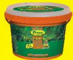
Engrais gazon (longue durée)