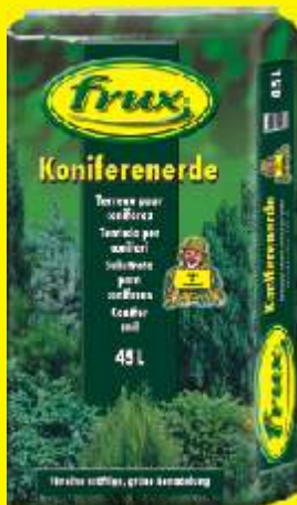
Terreau pour conifères Conditionnement: 45 L