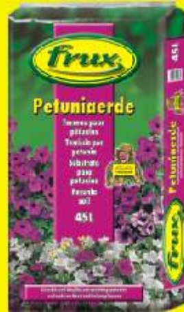
Terreau pour pétunias