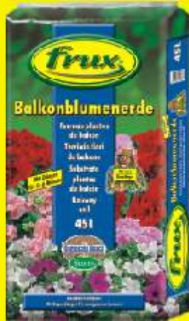
Terreau plantes de balcon