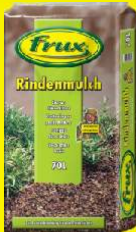
Ecorces décoratives (mulch) 00-16 / 10-40