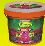
Engrais spécial rosiers