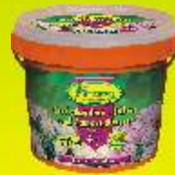
Engrais spécial rhododendrons