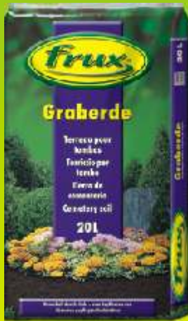
Terreau pour tombes

Conditionnements: 10 / 15 / 20 / 45 / 70 L