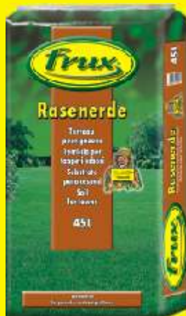
Terreau pour gazons Conditionnement: 45 L