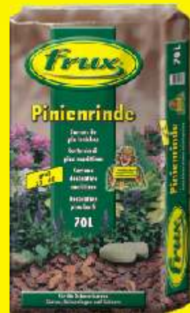
Ecorces de pin fraîches 25-40