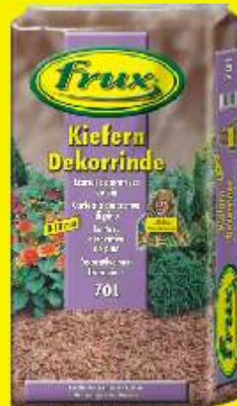
Ecorces décoratives de pin 00-10