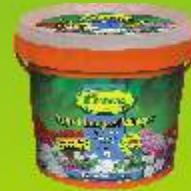
Engrais longue durée enrobé