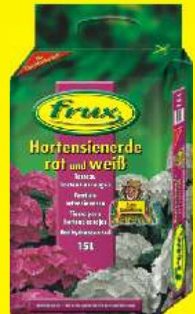
Terreau hortensias rouges