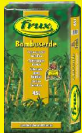
Terreau pour bambou Conditionnement: 45 L