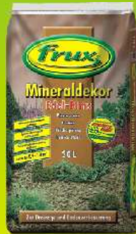
Décor minéral pierre ponce