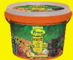
Corne en grains