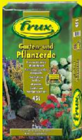
Terreau de jardin et plantation Conditionnements: 45 / 70 L