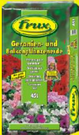
Terreau pour géraniums