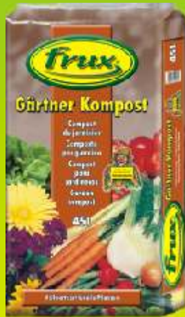
Compost du jardinier

Conditionnements: 10 / 15 / 20 / 45 / 70 L