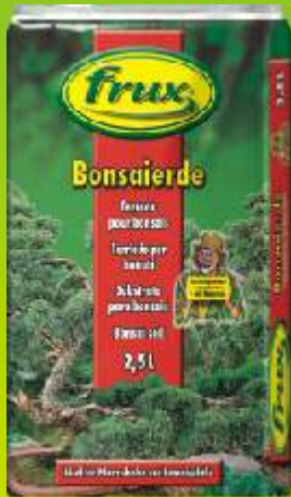
Terreau pour bonsaïs Conditionnement: 2,5 L