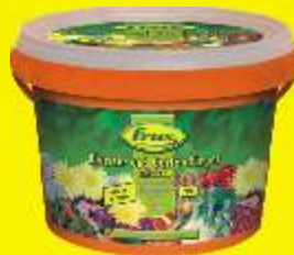
Engrais fleurs et jardin