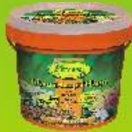
Engrais longue durée