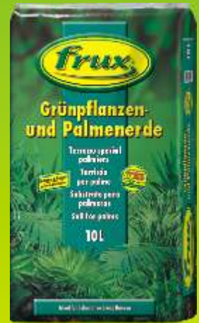
Terreau spécial palmiers Conditionnements: 5 / 10 / 20 L