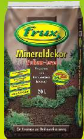
Décor minéral pouzzolane