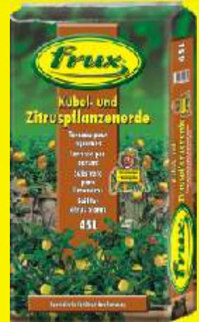
Terreau pour agrumes