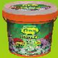
Miracle de fleurissement (sel nutritif)