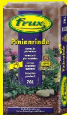
Ecorces de pin fraîches 10-25