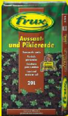
Terreau de semis Conditionnements: 10 / 20 L