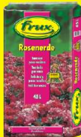
Terreau pour rosiers Conditionnements: 20 / 45 L