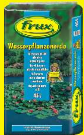
Terreau spécial plantes aquatiques Conditionnements: 20 / 45 L